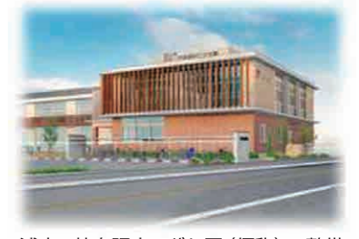
浦安・芳泉認定こども園(仮称)の整備