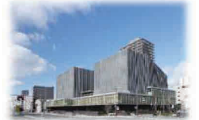
岡山芸術創造劇場ハレノワの開館